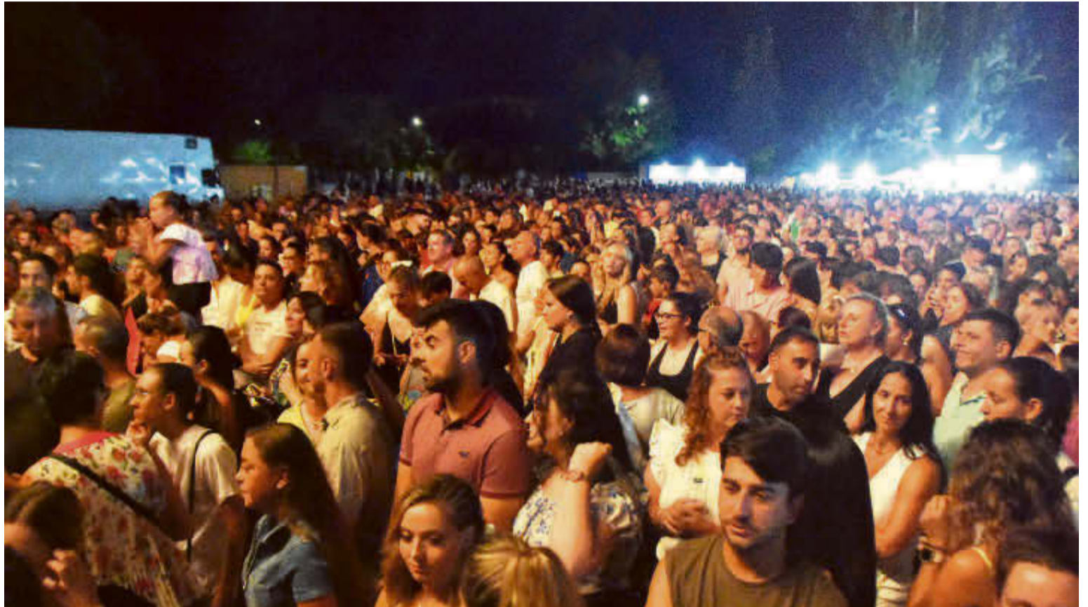
Cerca de 5.000 personas, llegadas desde diferentes puntos de la provincia, disfrutaron de la última cita del Festival Noches del Tormes.