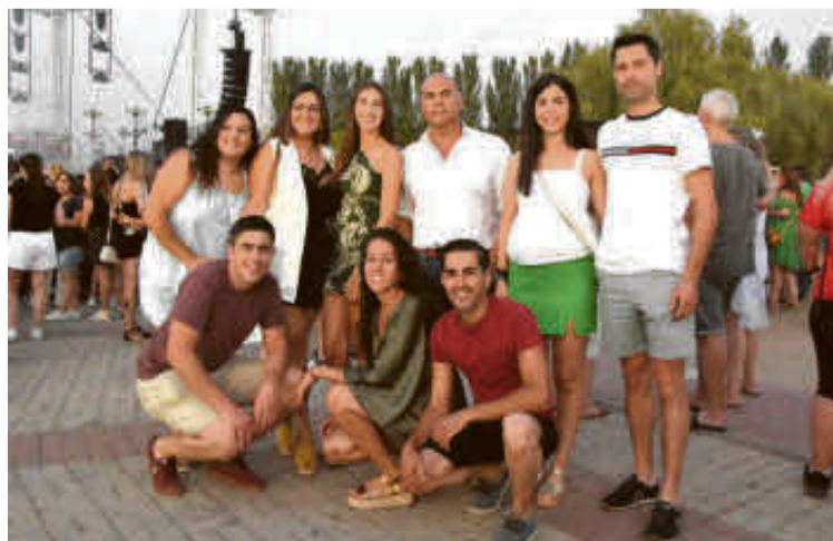
Desde las nueve de la noche los asistentes acudieron a la cita musical.