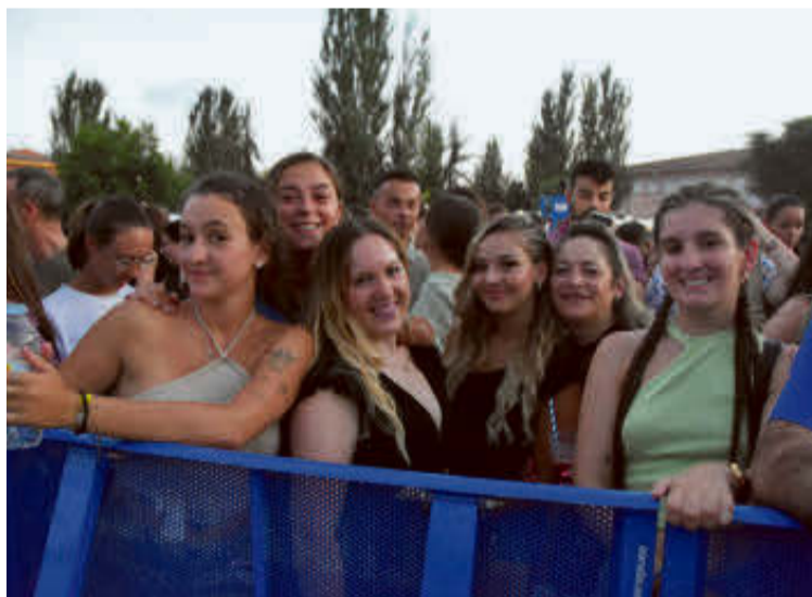
Un grupo de amigas en la primera fila del concierto.