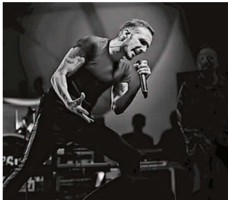
Imagen de El Maki en uno de sus conciertos.