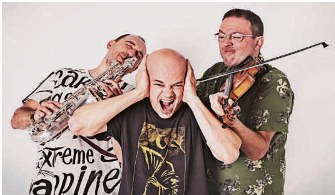
El grupo Celtas Cortos actuará en la plaza Tierno Galván de Santa Marta de Tormes el viernes 30 de julio.