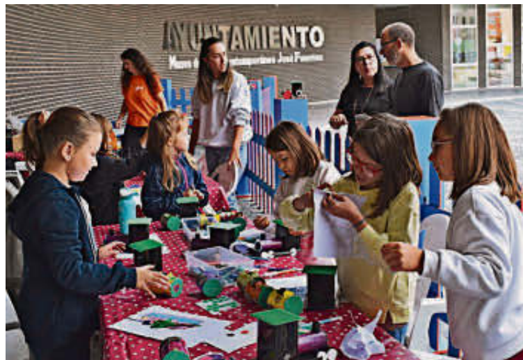
Algunos de los asistentes que participaron en los talleres. EÑE

Por otro lado, el mal tiempo condicionó la jornada de actividades y la lluvia previa al inicio de los talleres impidió instalar los hincha-