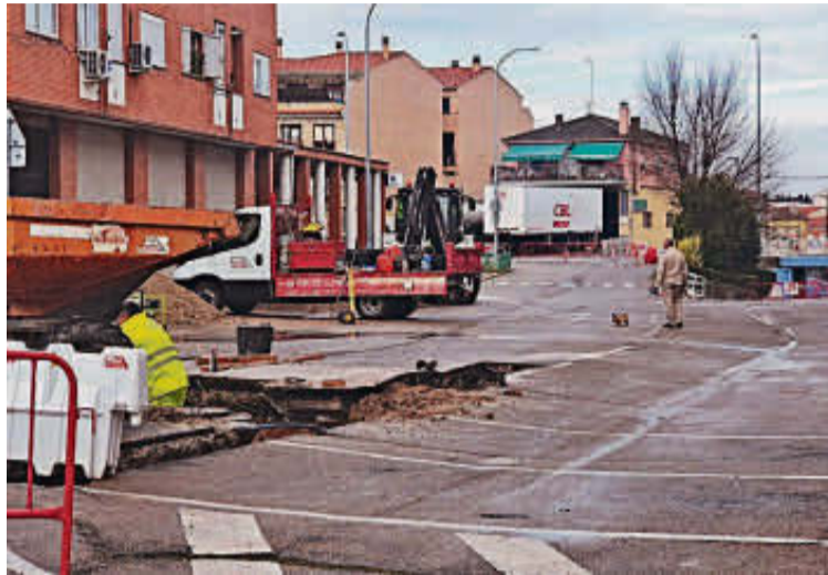
La nueva fase de obras en la avenida José García Santos. EÑE

La intervención se aprobó el pasado mes de mayo y contará con una inversión en la que se unirán tanto una parte de remanente de tesorería de las arcas municipales, consistente en 357.000 euros, como otros 80.000 que se sumarán a esta cantidad inicial procedentes de los Fondos de Cohesión.