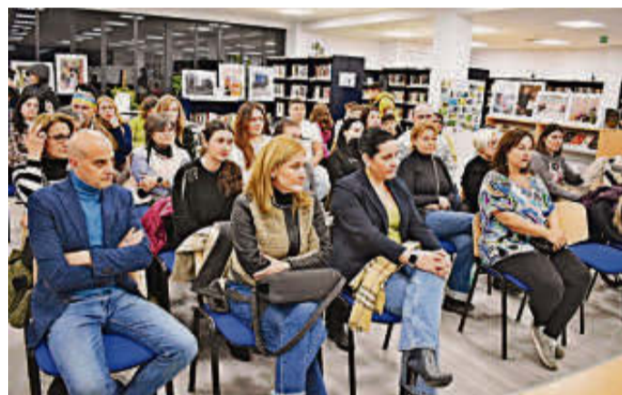
Público en la presentación de un libro en la biblioteca.