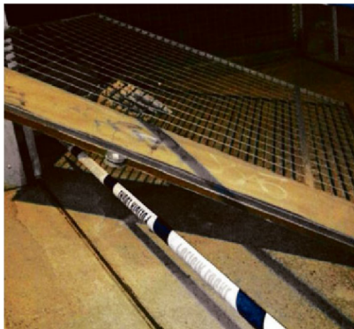
Los jóvenes arrancaron las puertas de acceso a las piscinas municipales.

Aunque algunos vecinos dieron aviso a la Policía Local de que había jóvenes dentro de las piscinas, cuando llegaron los agentes, que habían estado regulando el tráfico en otras zonas del municipio con motivo de los actos iniciales de las fiestas, no pudieron evitar encontrarse ya los