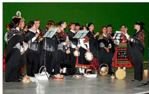
Comienzan los cursos del IDES. El Instituto de las Identidades (IDES) de la Diputación ha organizado 26 talleres de cultura tradicional en 19 municipios, en los que participan más de 350 alumnos, como en el curso de música tradicional de Villares.

Asimismo, dentro del programa de actividades se incluye como novedad el "café-corto", en el que tras visionar un cortometraje se iniciará un debate y análisis sobre la historia, y también se han organizado excursiones culturales y la visita a unas bodegas de Toro, además de la posibilidad de asistir a las conferencias para mayores en Salamanca.