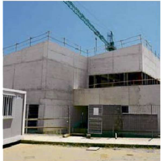
Las obras del tercer colegio que se están realizando en el Camino Arapiles./EÑE

Por ahora, este municipio del área periurbana de la capital será, junto con Santa Marta —que es la segunda localidad más poblada de la provincia—, el único en contar con tres centros escolares con capacidad para atender las necesidades educativas de los niños de entre tres y doce años puesto que, tiene en funcionamiento el colegio Pablo Picasso y el colegio La Ladera al que se sumará a final de año el nuevo recinto educativo cuyas obras comenzaron en noviembre del pasado año.